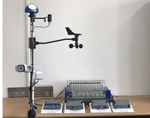
[ 네오팜 전시제품 ]